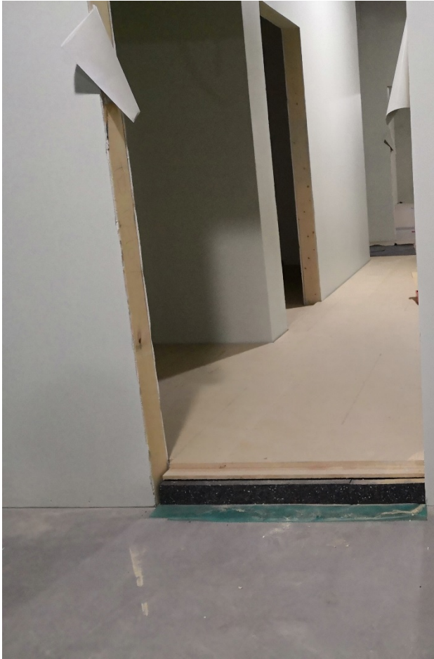
Bild 3 - Uppbyggnad av golv i slöjd