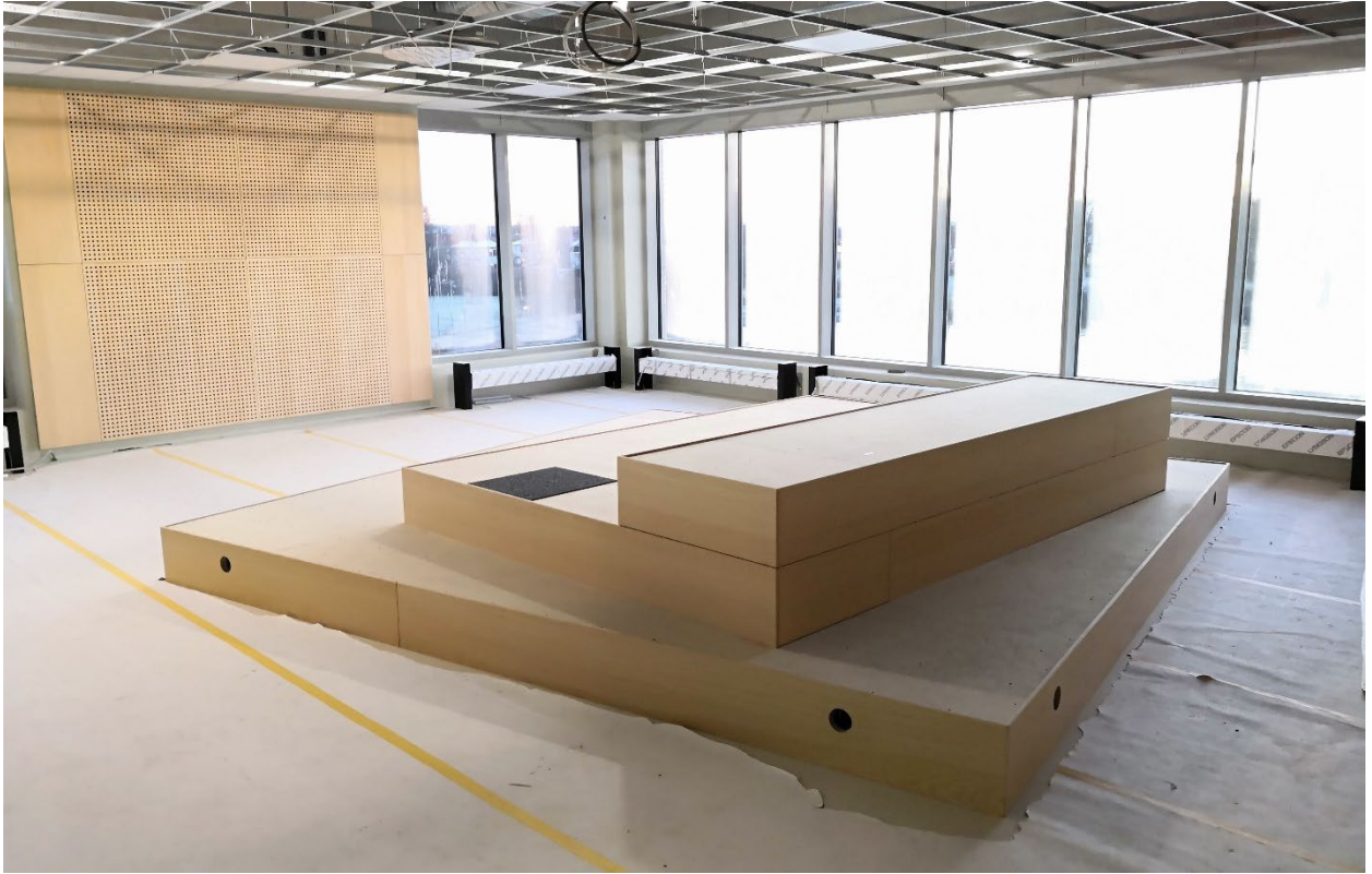
Bild 2 - Gradäng vid torg i hemvist på plan 3