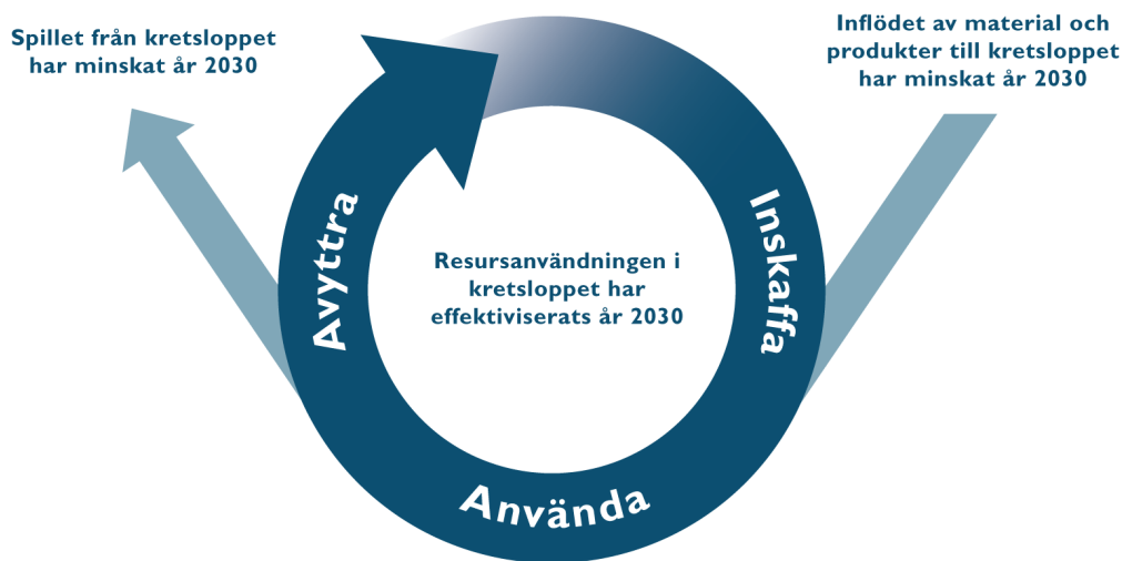
Figur 1 Tre övergripande mål har formulerats för den nya gemensamma kretsloppsplanen. Dessa fungerar också som utgångspunkt för barnkonsekvensanalysen.

För att säkerställa att barnens behov inte åsidosätts i processen med att ta fram kretsloppsplanen och genomföra tillhörande åtgärder har en barnkonsekvensanalys genomförts.